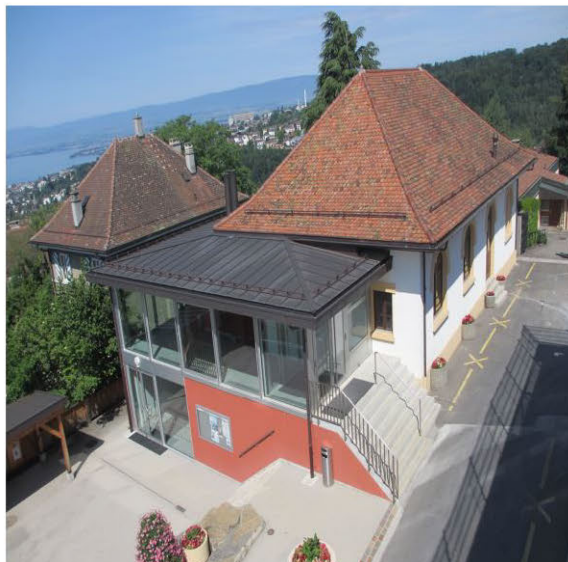
Grande Salle Centre de Belmont