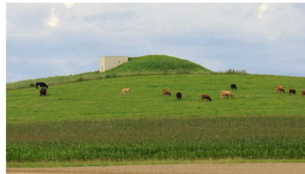
Réservoir de la Métraude.

La Compostière de la Coulette transforme le bois des forêts communales privées (environ 45 hectares) en plaquettes avec lesquelles nous