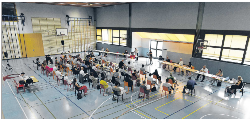
L'assemblée, réunie dans la salle de gymnastique du complexe scolaire, afin de respecter parfaitement toutes les mesures sanitaires imposées par la pandémie

Le procès-verbal de la séance du 5 décembre 2019 a été accepté, sauf 3 abstentions. A la suite de plusieurs démissions, il a été décidé de procéder à l'assermentation de trois nouveaux conseillers en plus de celle prévue à l'ordre du jour. Ce sont donc