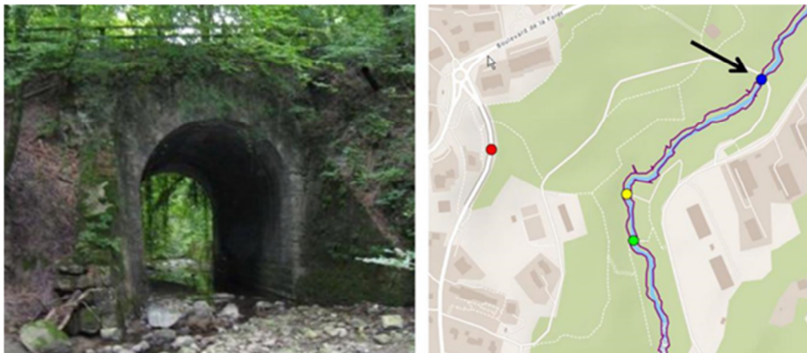
Photo et plan de situation du voûtage de la Paudèze, ch. du Stand

En 2016, une inspection a été menée et quelques recommandations d'intervention ont été proposées. Par la suite, un projet d'intervention et un appel d'offres ont été réalisés sur cet ouvrage pour l'exécution des travaux. Ceux-ci consistent à :